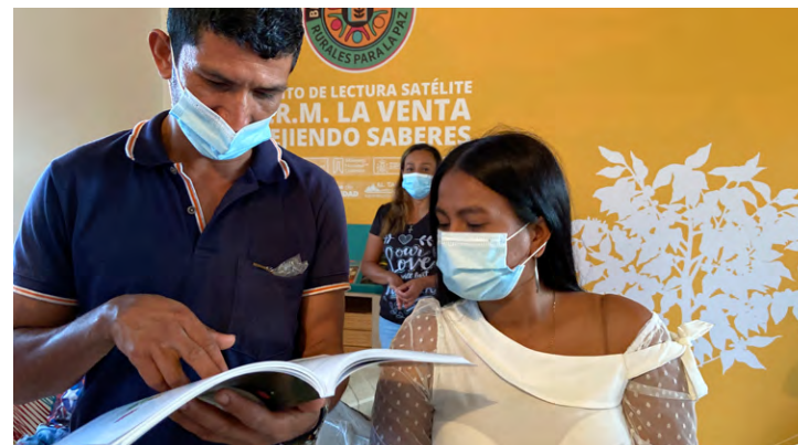
Inauguración de la «Biblioteca pública rural para la paz» Cuatro Esquinas, El Tambo, Cauca (2021)