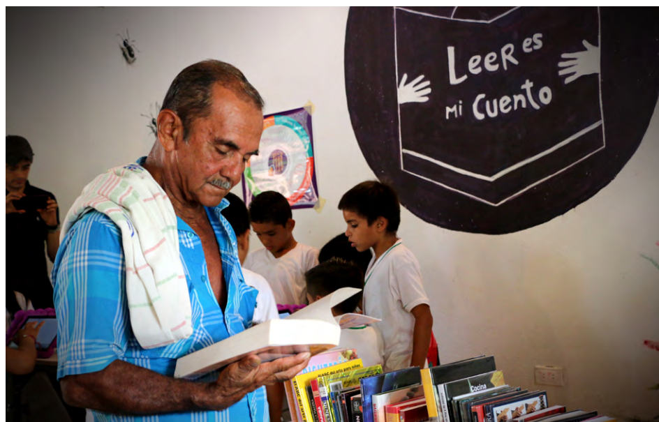
Biblioteca Pública Móvil, vereda La Cooperativa, en Vista Hermosa, Meta