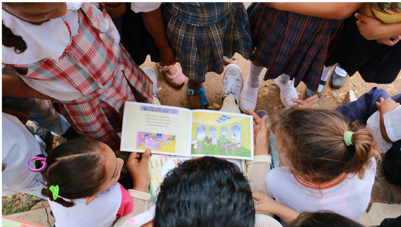
Estudiantes en la Biblioteca Pública de Conejo, La Guajira, finalista Premio Nacional de Bibliotecas Públicas Daniel Samper Ortega, 2018