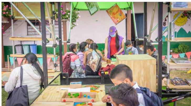
Inauguración de la «Biblioteca pública rural para la paz» de Samaniego, Nariño (2021)