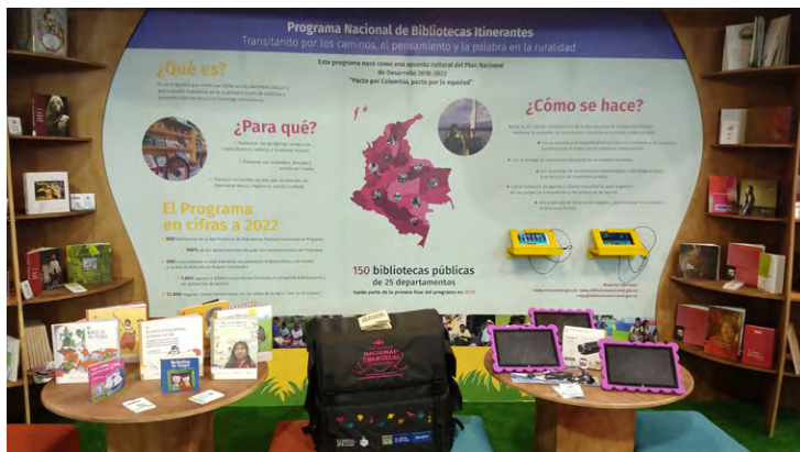
Programa Nacional de Bibliotecas Itinerantes, stand del Ministerio de Cultura en FILBo 2019