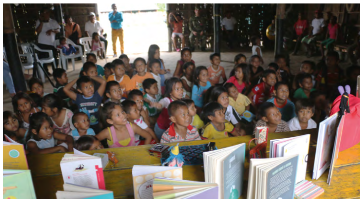
Programa «Escritores en las bibliotecas», Inírida, Guainía