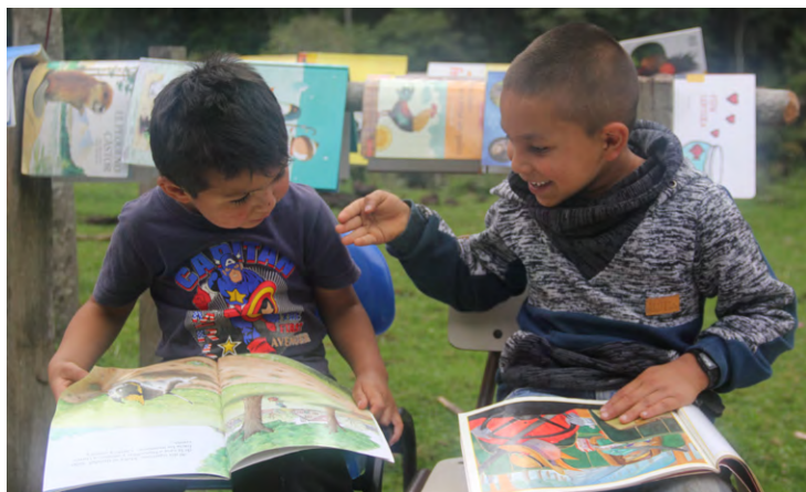
«Bibliotecas públicas por las veredas y los caminos de la paz», Planadas, Tolima (2018)