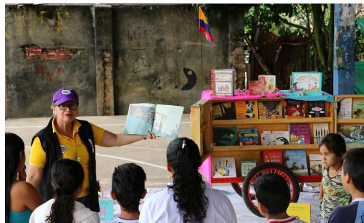
Programa de extensión bibliotecaria en el corregimiento El Limón, en Chaparral, Tolima