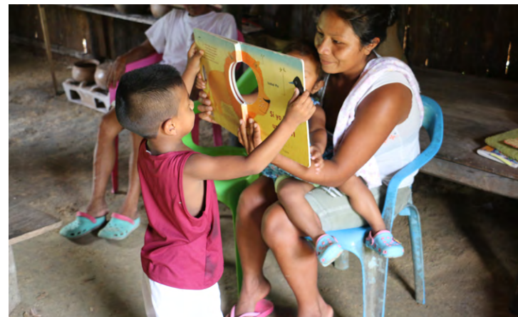
Participantes del programa «Escritores en las bibliotecas» en Vaupés, Mitú