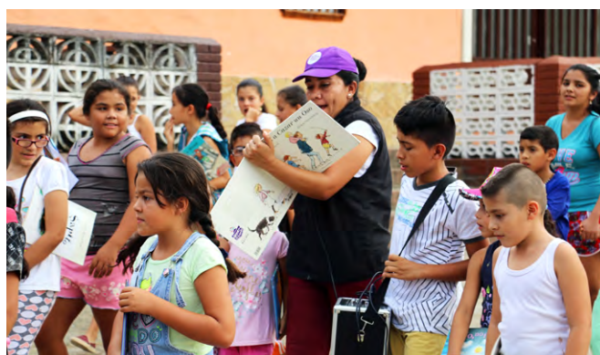
Servicios de extensión bibliotecaria, Biblioteca Pública Municipal de Chaguaní, Cundinamarca (2017)