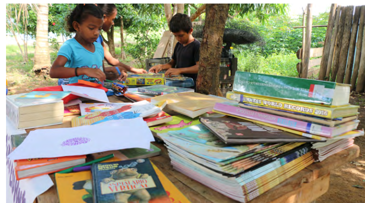
Biblioteca Pública Gallo, Tierralta, Córdoba